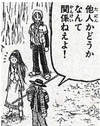
出典「東遊記」 酒井ようへい氏 小学館 より

もし今度の相手が、高速スライダーの使い手ならば、3人のピッチャーにそれぞれ投げてもらって打つ練習をすることが効果的なのも、同様の理由です。